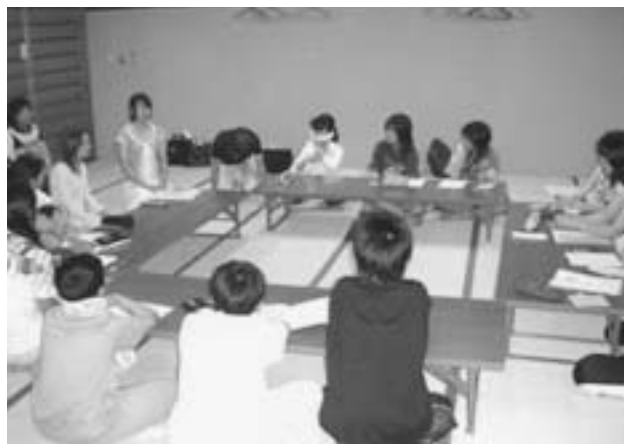
第2回事前研修会「希望の家」にて

派遣団に選ばれた中学生14人（3年8人、2年2人、1年4人）は、6月24日「希望の家」にて宿泊研修を行いました。そこでは、マレーシアについての学習会やマレー語・英語講座、昨年度の派遣団員やマレーシアに在住されていた方から経験談を聞くなどの研修を行いました。今回派遣される中学生たちはとても元気がよく、アトラクションの練習にも意欲的に取り組み、楽しく研修会を終えることができました。